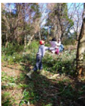
父と子で森に親しむ 風景を守りたい

昨年春に「森林の風」の会員に入れていただき、すぐさま「機関紙発行の編集係り」を仰せつかりあつという間に一年が過ぎようとしています。