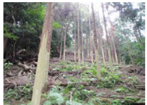
2009年10月 食害で枯れてしまいました