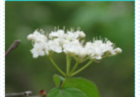
ガマズミの白い花