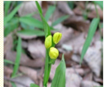
里山の女王 キンラン