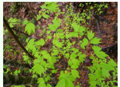
シロモジ。チューリップみたいな葉っぱとそうでないのと。

3. 松の林では、焼き火をしてはいけない。焼き火の跡にだけ発芽して、松を集団で枯らすキノコ「ツチクラゲ」が発生する可能性が高い。