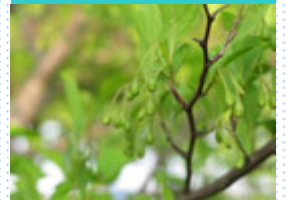
エゴノキの花芽 これも白い花が咲くのです