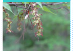
ウリハダカエデの種 ができかけています