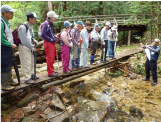
今回の執筆者たちも…。

チェーンソーの伐倒も「こうやるんだ、やってみろ」、8mの枝打ちも「まあ、のぼってみろ」と、体で覚えこむ式であったが、今思えば楽しい日々ではあった。(今ではその社長も引退し、後から加わった私の友人2人と息子が中心になってやっている)