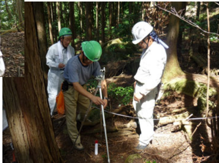
杭の中心部へ錘を合わせる