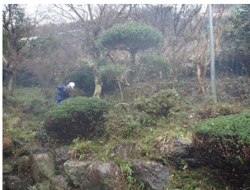
これも若干撮影位置が違うが（左写真・左端の傘型の柘植が、右写真の真ん中）、下草がスッキリした様子が分かっていただけるかと思う。